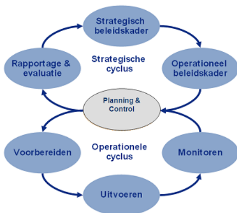
Afbeelding 1. 'de dubbele regelkring'

De Wet algemene bepalingen omgevingsrecht (Wabo) en het daarop gebaseerde Besluit omgevingsrecht en de Ministeriele regeling omgevingsrecht stellen eisen aan de VTH-taken in het fysieke domein (voor bijvoorbeeld voor de werkvelden bouw, milieu, bodem en ruimtelijke ordening). De eisen zijn gebaseerd op 'de dubbele regelkring (BIG-8; zie afbeelding hierna)' en zijn vertaald naar procescriteria. Gedeputeerde Staten van Noord-Holland houden Interbestuurlijk toezicht op de wijze waarop wij hieraan voldoen. Jaarlijks rapporteren Gedeputeerde staten hierover aan het college.