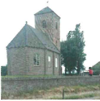
Het middeleeuwse kerkje