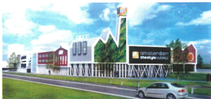
Industriële iconen als gevelbeeld

Belangrijke ontwikkelingen in de gemeente waarover de commissie in 2014 heeft geadviseerd zijn het plan voor een groot winkelcentrum met parkeergarage op het Sugar City terrein in Halfweg. Dit plan is door Soeters en van Eldonk Architecten, de oorspronkelijke ontwerpers van het beeldkwaliteitplan en het stedenbouwkundig plan ontworpen en diverse malen met de commissie in vooroverleg besproken alvorens tot vergunningsaanvraag over te gaan. De gemeente heeft het plan getoetst aan de oorspronkelijke randvoorwaarden uit het beeldkwaliteitplan.