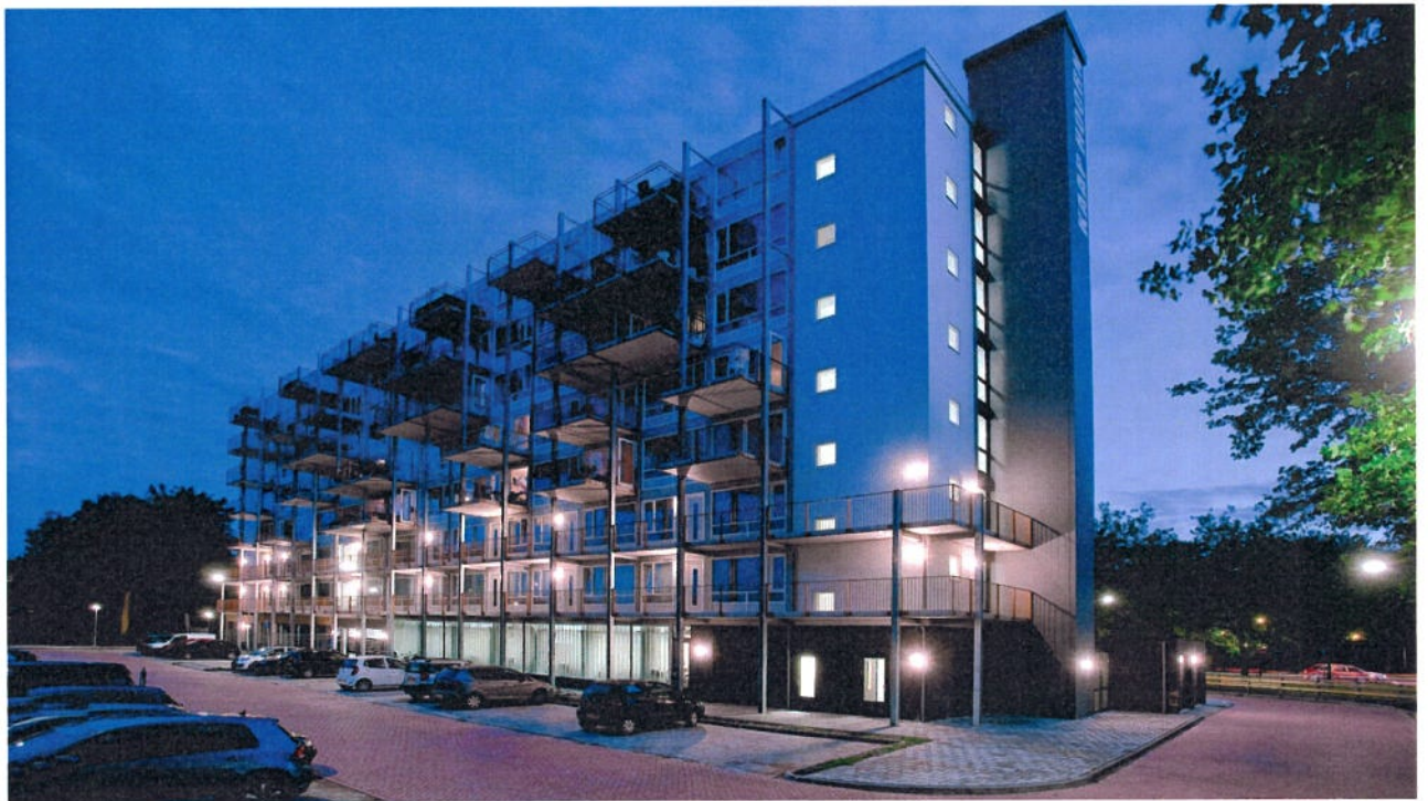
83 appartementen Kaap Hoorn Hoorn | Transformatie verpleeghuis tot 83 startersappartementen – Monumentenprijs 2016