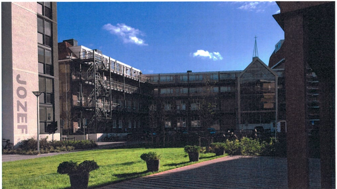
Voormalig Lidwinaziekenhuis en Tjempaka project Den Helder | renovatie van 78 woningen in voormalig ziekenhuis en nieuwbouw van 110 zorgwoningen