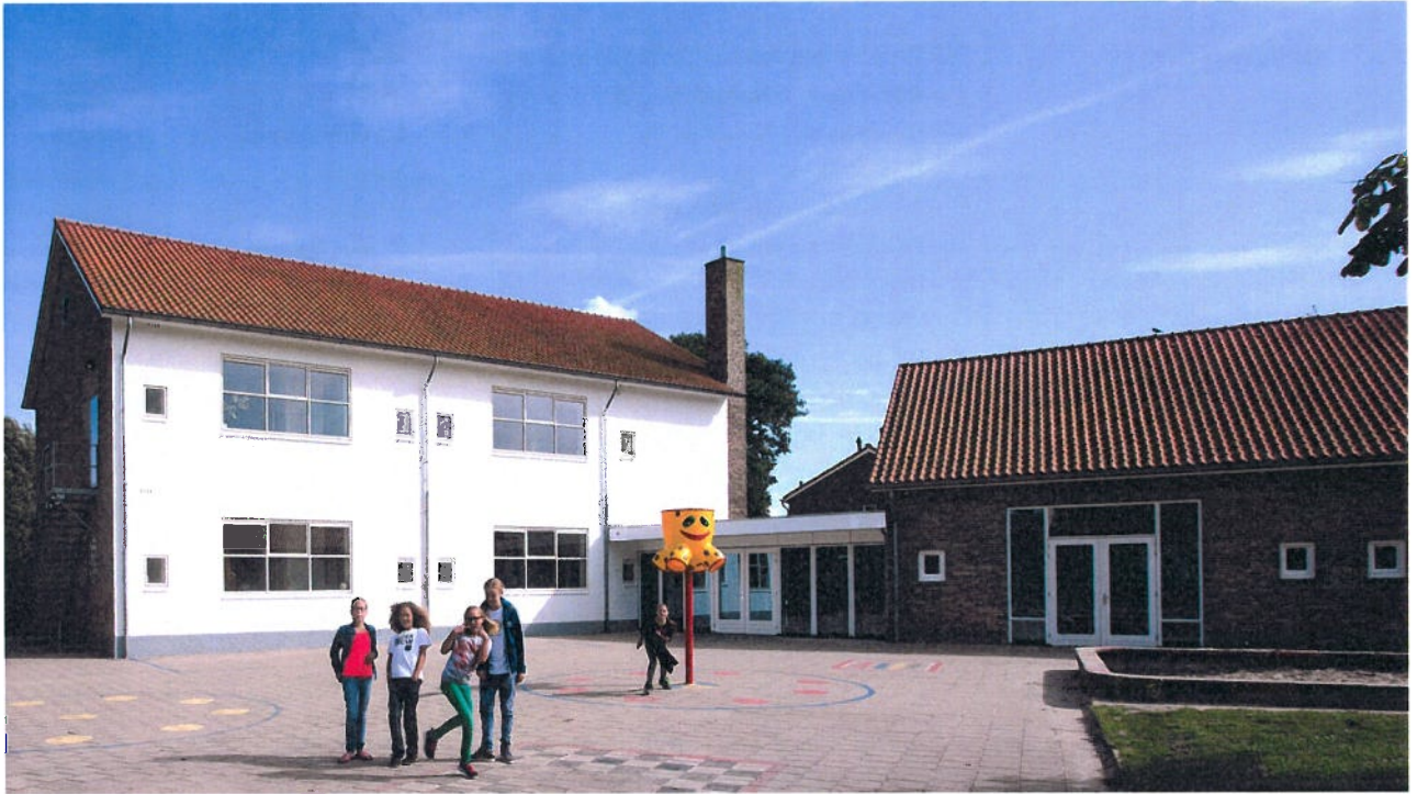
RKBS de Drietand Den Helder | renovatie – uitbreiding van een bestaande school uit de wederopbouwperiode