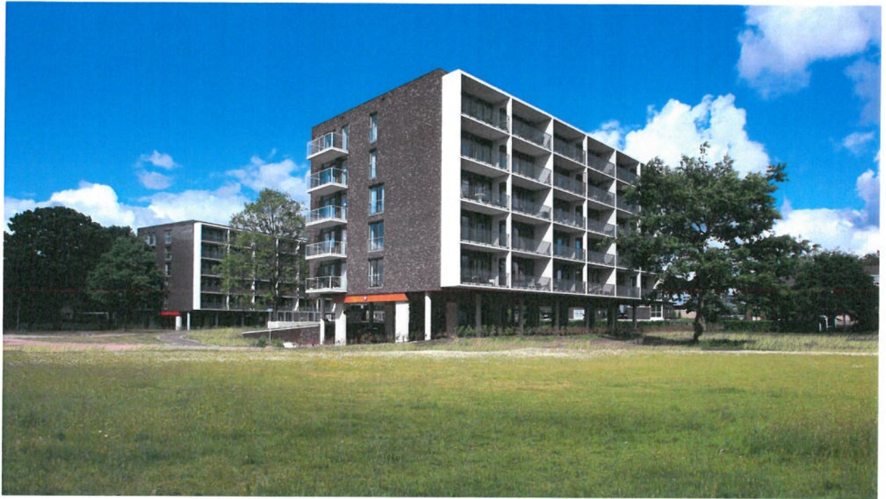
75 appartementen Groene Gordijn Bergen op Zoom | nieuwbouw van 3 pilotisgebouwen op de voormalige Cort Heyligerskazerne