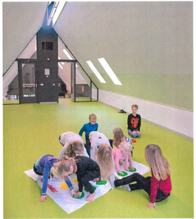
RKBS stJoseph Burgerbrug | nieuwbouw van een kleine dorpschool – nominatie Arie Keplerprijs 2016 categorie Utiliteitsbouw