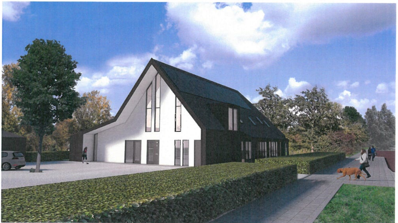
Hospice Schagen | nieuwbouw van een woonverblijf voor palliatieve zorg