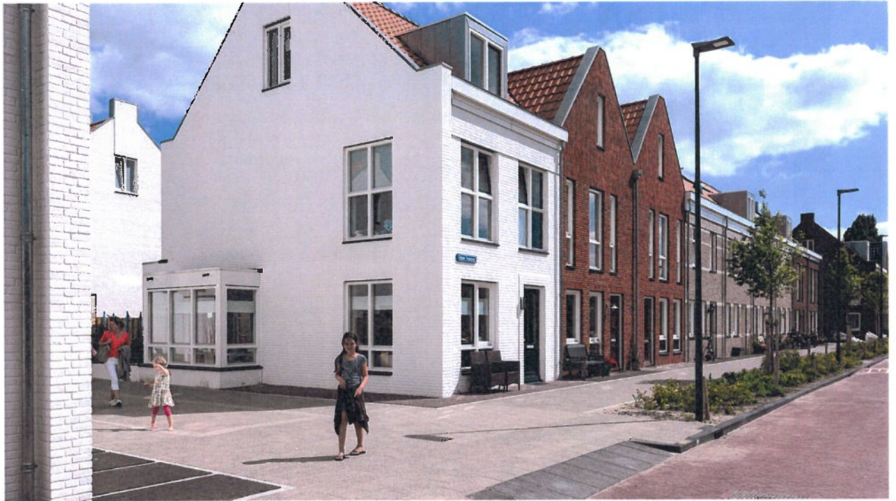
65 woningen Tevreewijk Leiden | nieuwbouw van 65 sociale koopwoningen in de binnenstad van Leiden