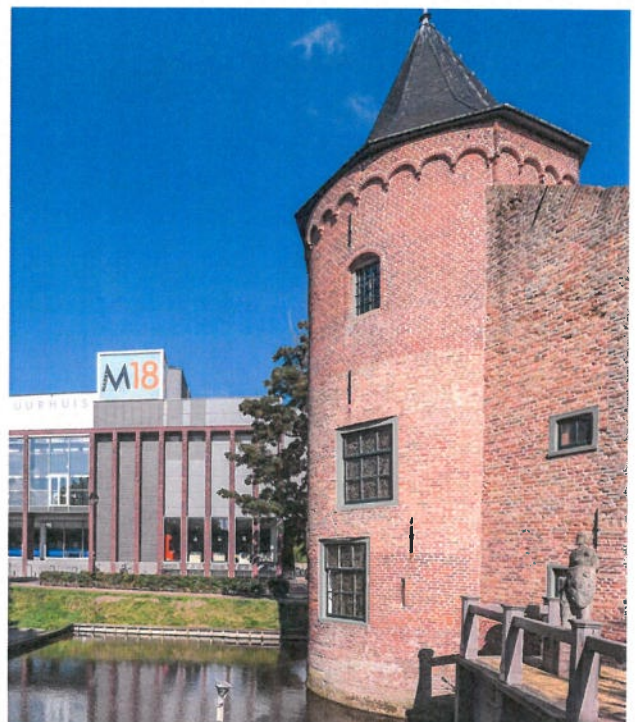
Cultuurgebouw M18 Schagen | nieuwbouw en hergebruik van het voormalige gemeentehuis Schagen tot cultuurgebouw en theater