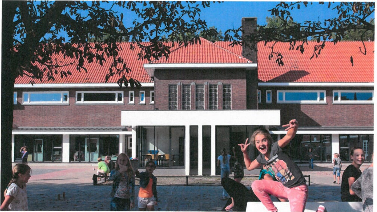
OBS Julianaschool Schagen | uitbreiding en restauratie van een monumentaal schoolgebouw uit de 30-er jaren