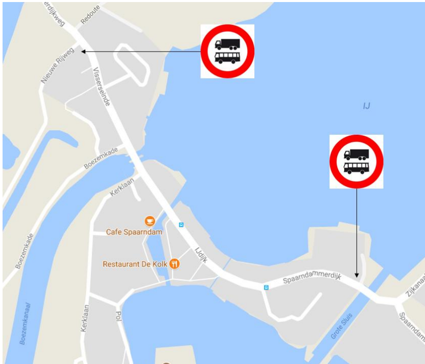
Locaties de te verwijderen verkeersborden