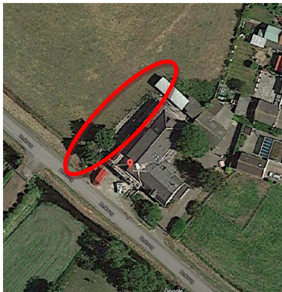
Rood omlijnd het perceel Kerkweg 2a, 2b en 2c.

Onderwerp Ontwerp weigering verklaring van geen bedenkingen voor het omzetten van een agrarische bestemming naar woonbestemming en daarmee het weigeren te vergunnen van het realiseren / aanleggen van een toegangspad, Kerkweg 2b en 2c te Haarlemmerliede. Volgvel 2