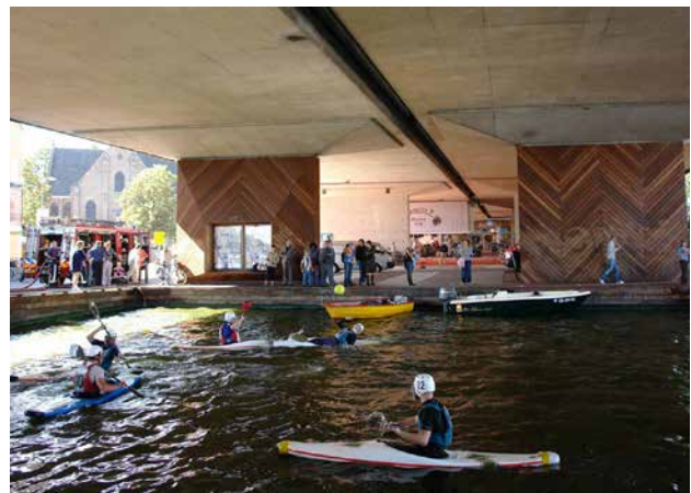
Voorbeelden kathedralen: links royale passage/ landmark en rechts een aantrekkelijke plek onder de brug