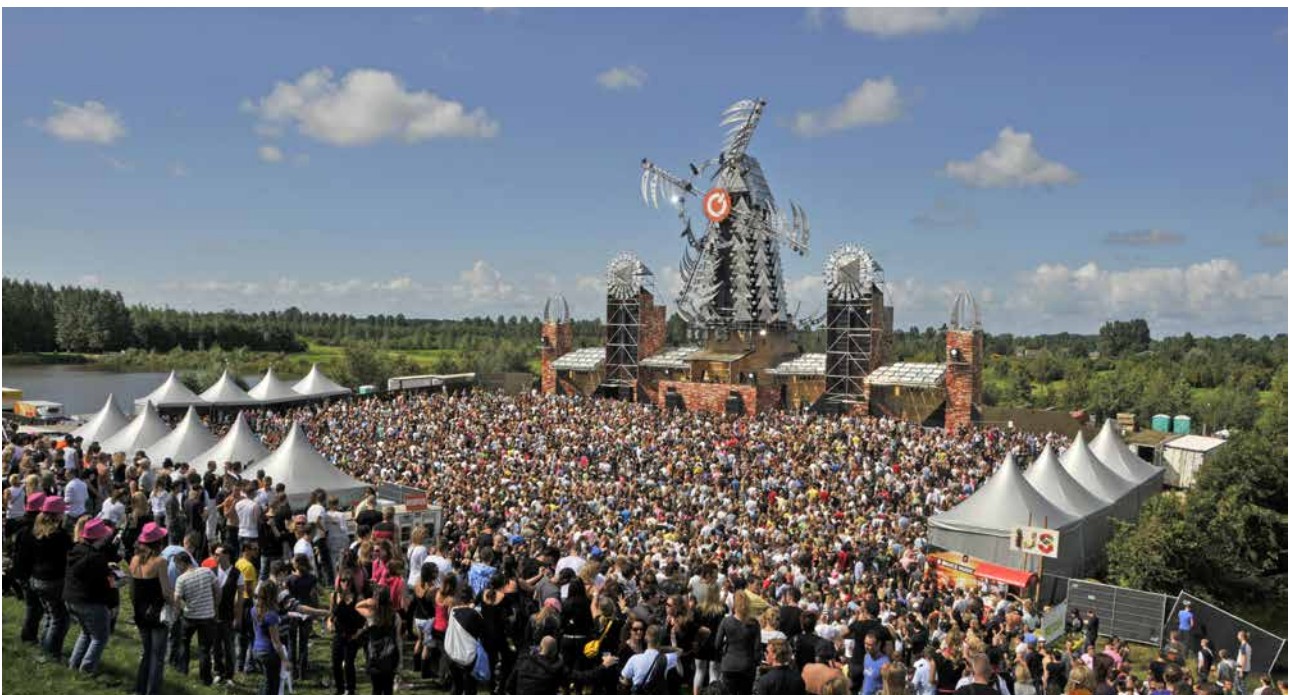
Mysteryland op het voormalig Floriadeterrein in de Haarlemmermeerpolder.