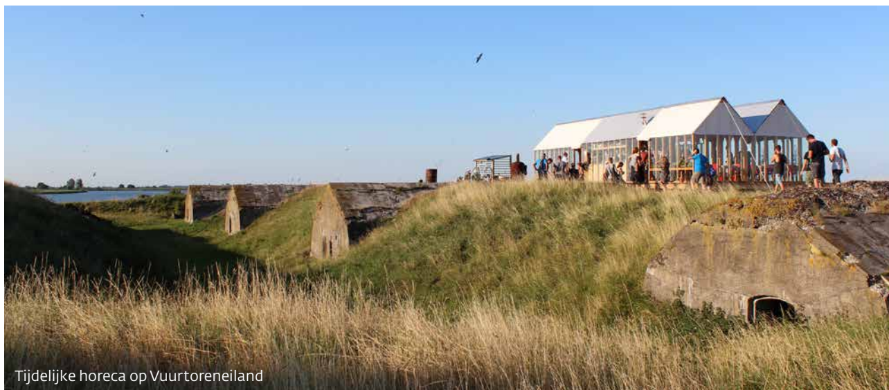
Tijdelijke horeca op Vuurtooreiland