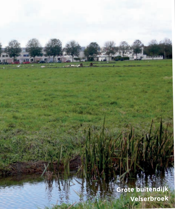
Grote buitendijk Velserbroek