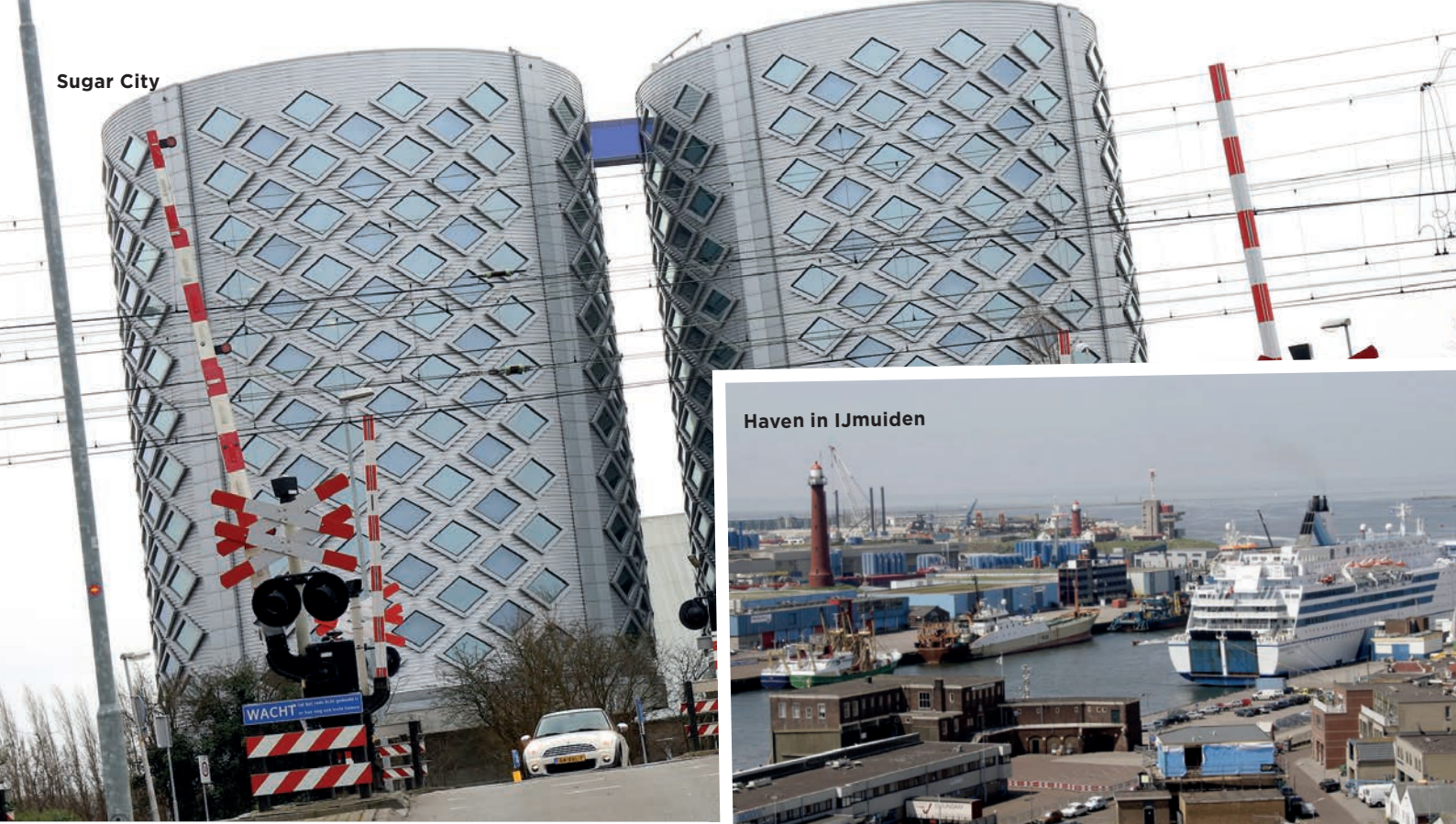
Haven in IJmuiden