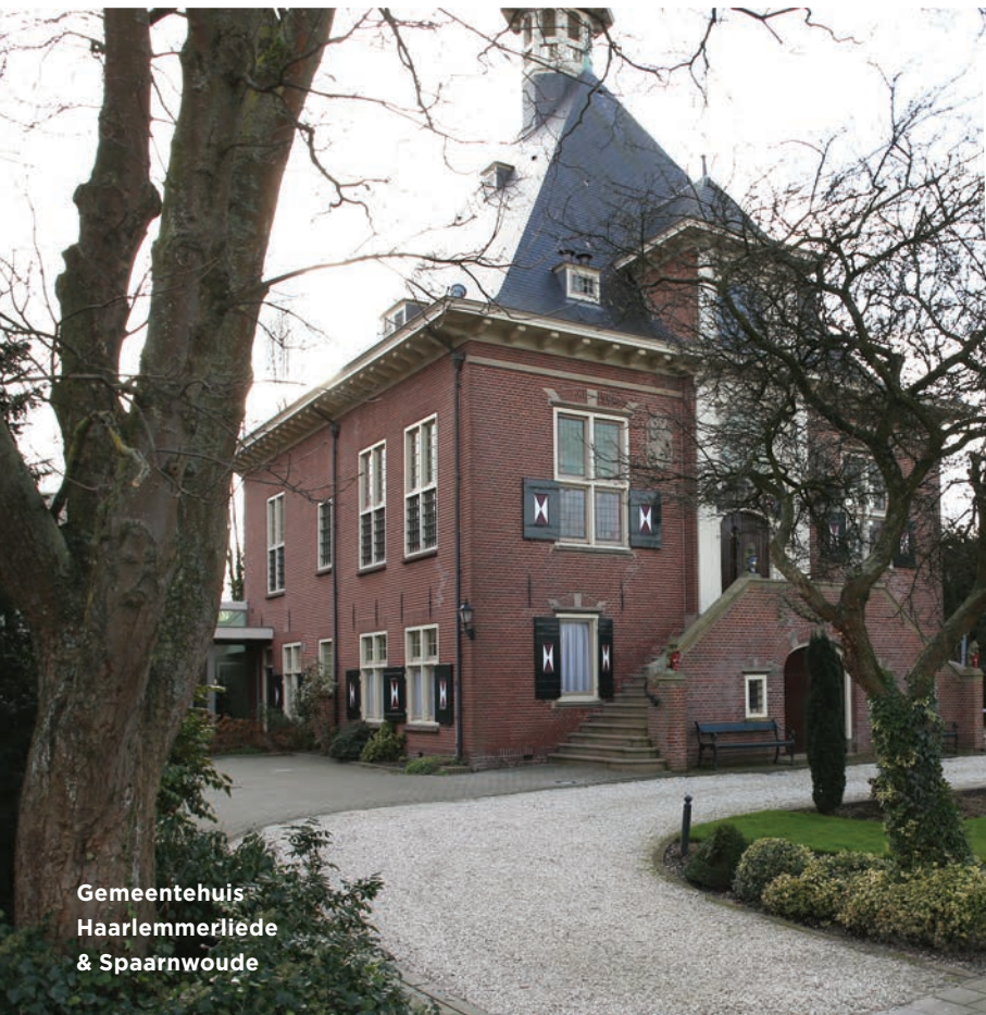
Gemeentehuis Haarlemmerliede & Spaarnwoude

Per jaar wordt bezien welke projecten of pilots worden opgepakt om de dienstverlening te verbeteren. De invoering van de flitsvergunning, het zaakgericht werken, het ondernemingsdossier, gebruik van social media, uitbreiding van digitale producten en aansluiting op 'mijn overheid' zijn daar belangrijke voorbeelden van. Daarnaast levert de gemeente Velsen op maat informatie aan ondernemers via ons ondernemersloket. In de publiekshal worden onze bezoekers ontvangen door een gastvrouw/-heer.