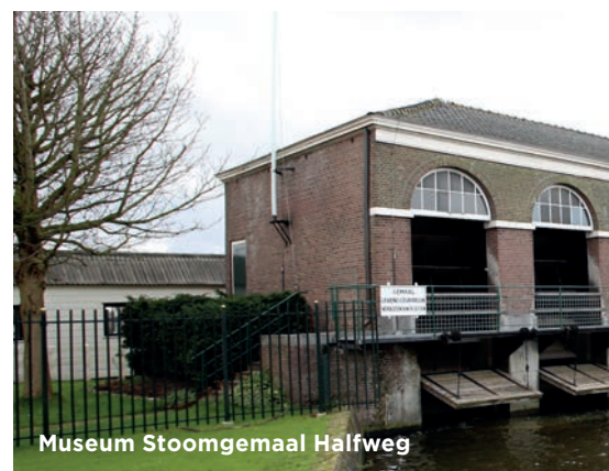
Museum Stoomgemaal Halfweg

Velsen zet volop in op het beschermen en toegankelijk maken van cultuurhistorisch erfgoed.