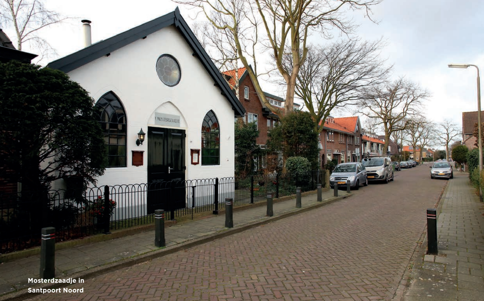
Mosterdzaadje in Santpoort Noord