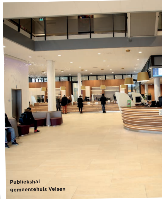
Publiekshal gemeentehuis Velsen