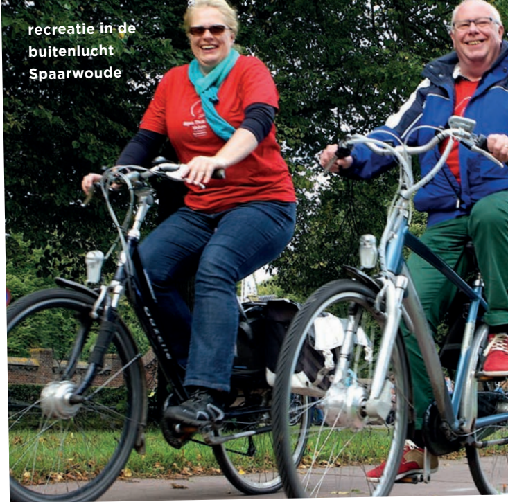
recreatie in de buitenlucht Spaarwoude