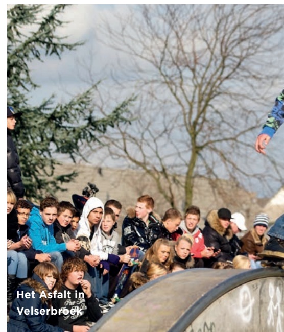
Het Asfalt in Velsersbroek

De visie van Haarlemmerliede en Spaarwoude voor de toekomst de recreatieve kwaliteiten en de belevingswaarde van het landschap wordt door Velsen gedeeld.