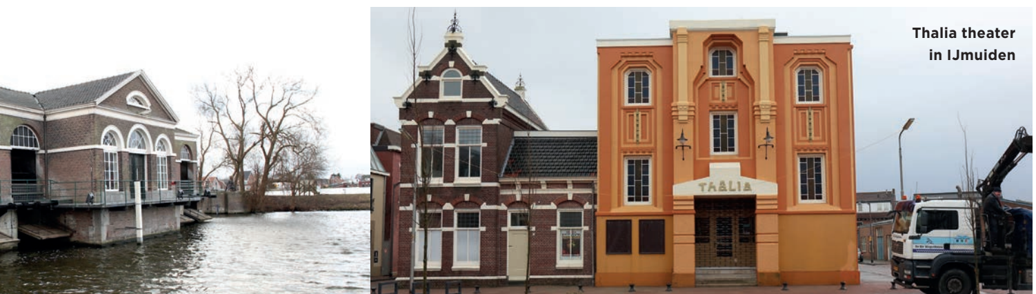
Thalia theater in IJmuiden

Een actief dorpsleven, een gebundeld pakket aan culturele voorzieningen en ruimte voor sport zorgen voor een rijk geschakeerd leefklimaat in alle kernen.