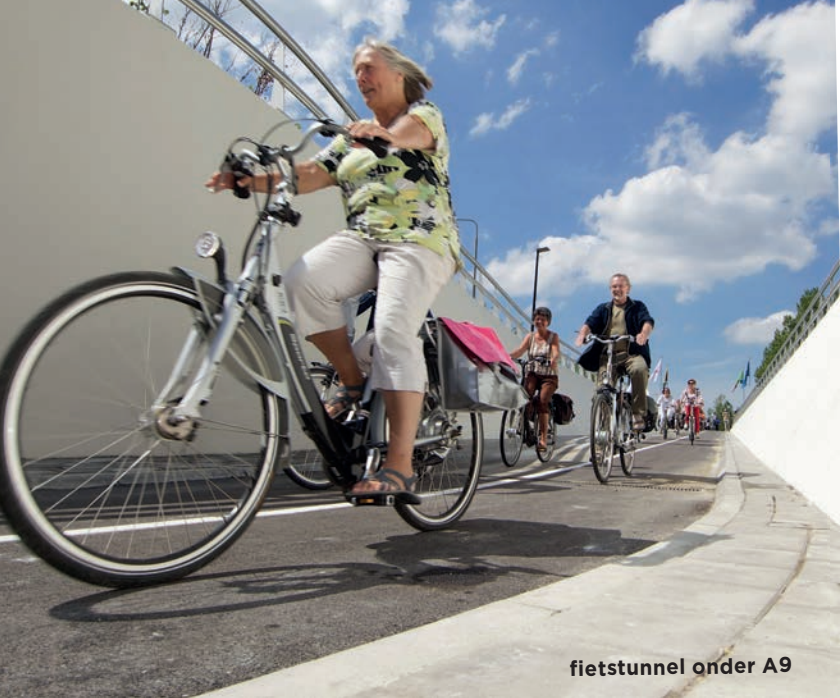
fietstunnel onder A9