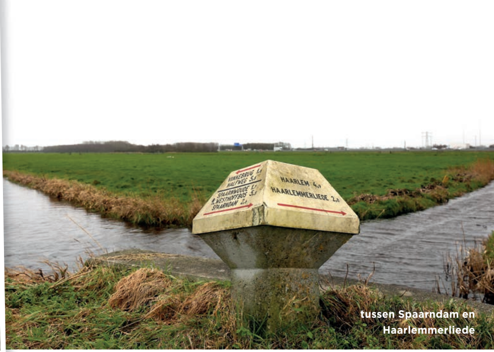
tussen Spaarndam en Haarlemmerliede