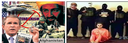
Radicalisme Extremisme en Terrorisme

Geen enkel wapen is zo dodelijk als het huidige terrorisme. Terrorismen werd na 11 september het middelpunt van het strategisch- militaire denken en handelen in de internationale politieke relatie.