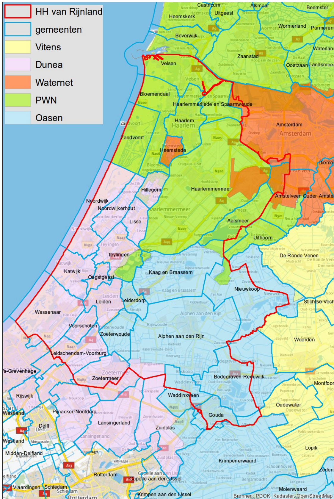
Bijlage 3 overzichtskaart betrokken waterbedrijven