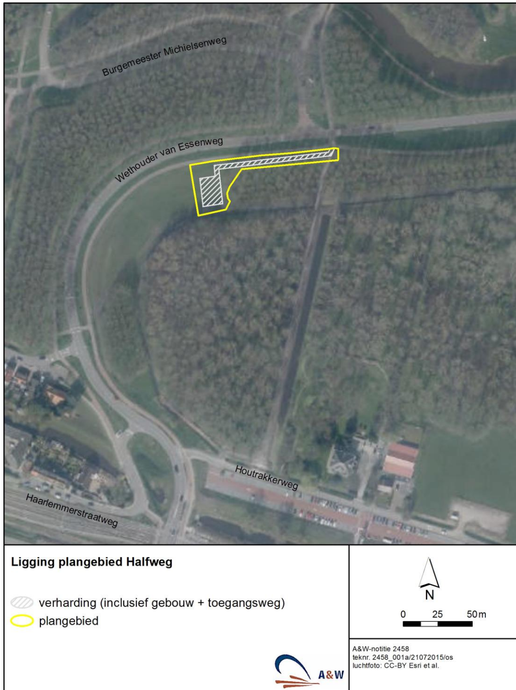
Figuur 1 - Ligging van het plangebied in de omgeving.

Wethouder van Essenweg. In totaal zal ongeveer 0,0575 ha grasland worden verhard (figuur 1). De rest van het plangebied wordt niet verhard en zal onderdeel blijven uitmaken van de huidige natuurwaarden. Het plangebied wordt omgeven door een hekwerk. Langs de bebouwing wordt veiligheidsverlichting aangebracht die zo min mogelijk naar de omgeving zal uitstralen. Alle werkzaamheden worden uitgevoerd met reguliere middelen. Er worden geen bomen gekapt.