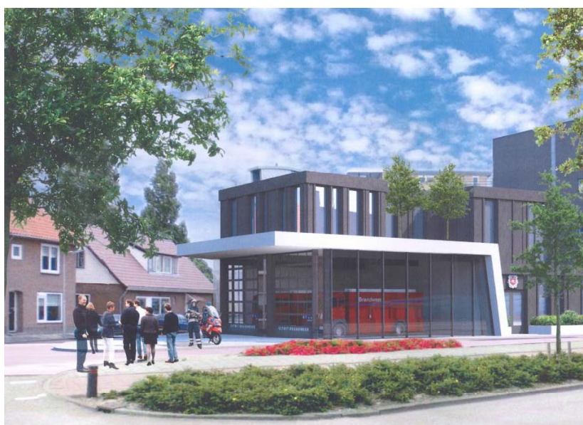
Nieuwe situatie Brandweerkazerne Beatrixstraat 2, Halfweg