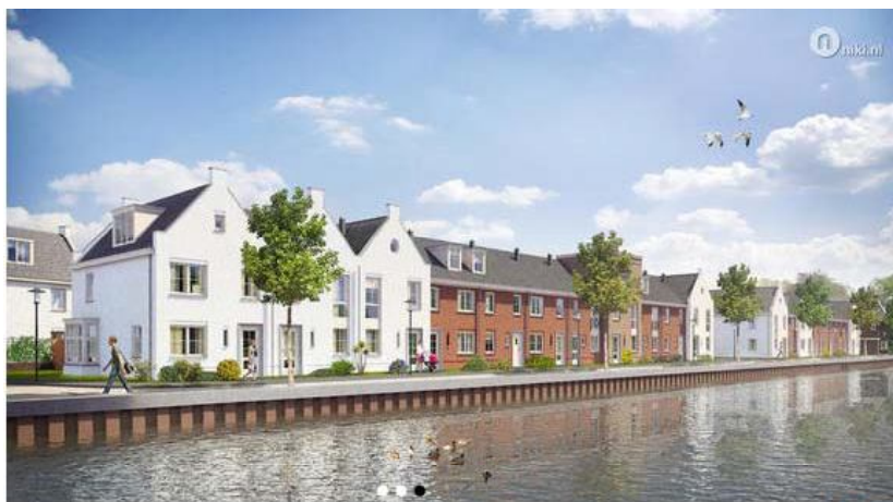
Nieuwbouw project Spaarndam