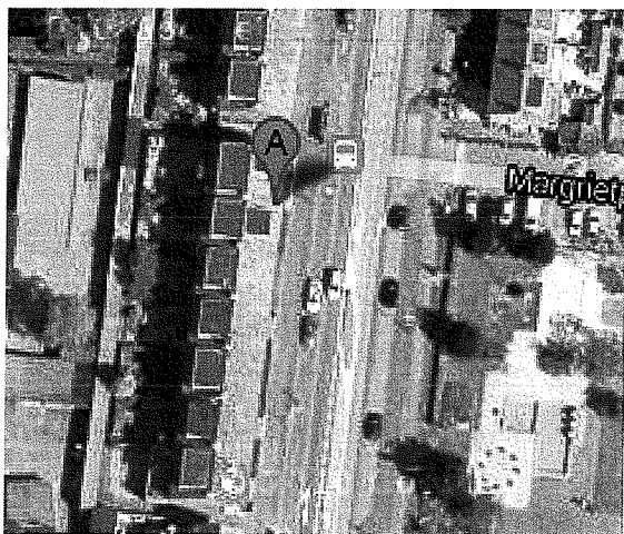
Locatie aan de Oranje Nassaustraat

Het blok ten noorden van het blok waarin het betreffende pand is gelegen, is eveneens voorzien van bovenwoningen, maar hier zijn op de begane grond woningen gelegen.