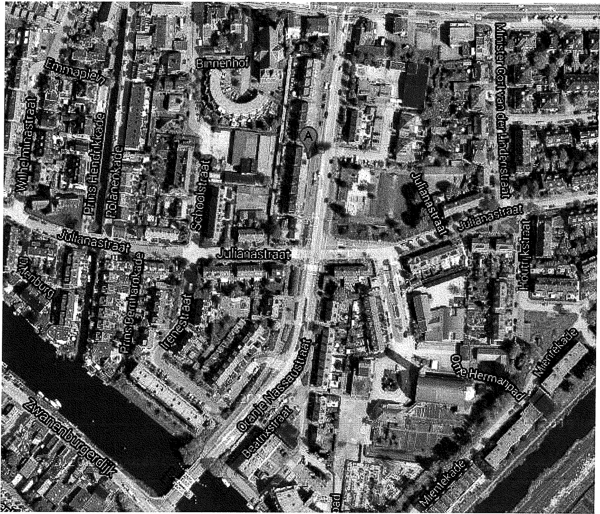
Ligging in Halfweg