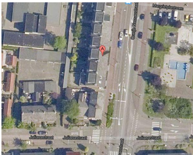
Locatie aan de Oranje Nassaustraat

Het blok ten noorden van het blok waarin het betreffende pand is gelegen, is eveneens voorzien van bovenwoningen, maar hier zijn op de begane grond woningen gelegen.